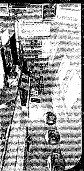
Corso Magenta - Vendita

In stabile depoca di grande fascino, ampia metratura distribuita su due livelli. Piano alto e affacci riservati per una dimora di sicuro charme, con possibilità di box. Classe energetica G - IPE 175 Kwh/m 2 anno.