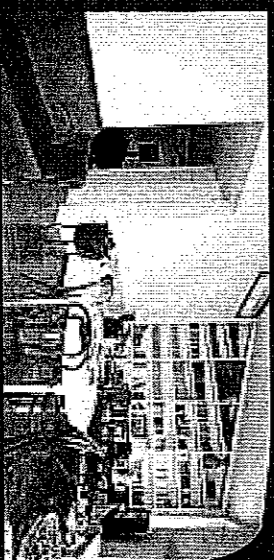
Porta Ticinese - Vendita

In stabile d'epoca, all'ultimo piano con ascensore, abitazione di 135 mq di nuova realizzazione. Spazi funzionali e dotazioni all'avanguardia, nel quartiere più esclusivo del centro storico. Classe energetica A2 - IPE 72,87 Kwh/m 2 anno.