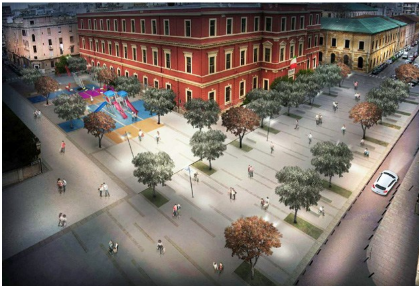
Progetto per Piazza del Redentore a Bari

02/01/2017 - È stata inviata nei giorni scorsi dalla Presidenza del Consiglio dei Ministri ai Comuni la comunicazione del finanziamento dei progetti candidati al Bando per la riqualificazione urbana e la sicurezza delle periferie delle città metropolitane, dei comuni capoluogo di provincia e della città di Aosta