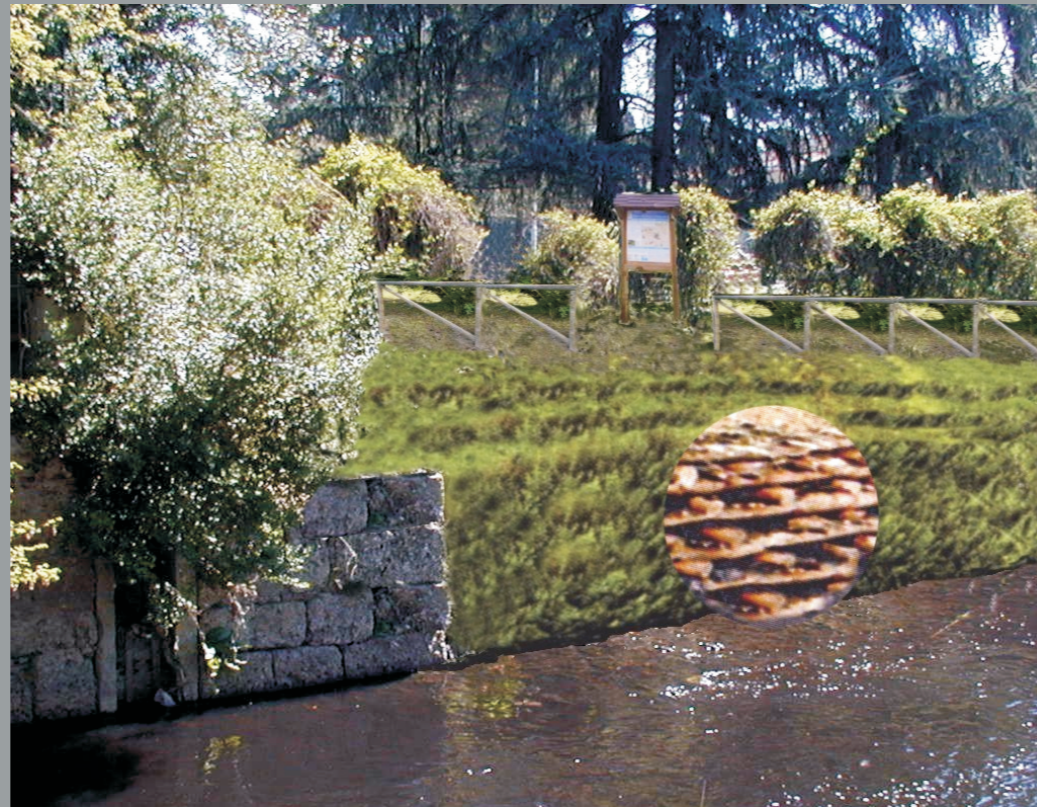
Simulazione situazione dopo l'intervento