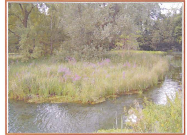
Riserva Naturale Sorgenti della Muzzetta - Testa Molino