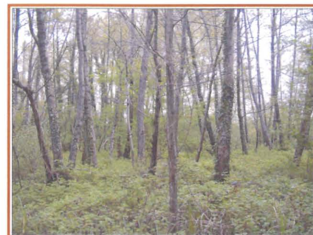
Il bosco igrofilo della Riserva

Le visite, condotte da personale specializzato, si snodano lungo un percorso didattico che attraversa i principali ambienti della riserva. L'itinerario è corredato di pannelli illustrativi, piazzole di sosta e di un capanno per l'osservazione dell'avifauna acquatica.