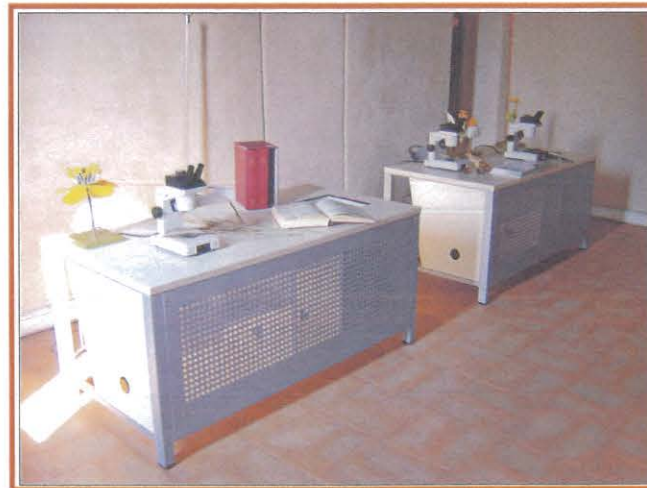
Sala attrezzata per il riconoscimento dei campioni vegetali

Grazie all'utilizzo di libri e strumentazioni scientifiche impareremo a riconoscere le specie più comuni del nostro territorio e a realizzare un erbario.