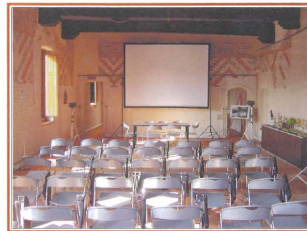
La sala conferenze

Conservando e valorizzando le strutture storiche, il Parco è riuscito nell'intento di adattare l'edificio quattrocentesco ad una fruizione collettiva, creando spazi espositivi, scientifico-didattici e di riunione su due piani.