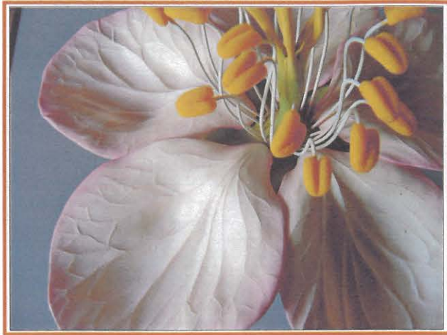
Particolare di un modellino botanico