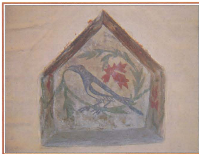
Il simbolo di Casa Gola: una gazza affrescata in una nicchia porta lume.

La storia dell'edificio non è nota: esso potrebbe essere il residuo di un complesso rurale articolato a corte chiusa, probabilmente conventuale, facente parte della vicina parrocchia, oppure residenziale, vista la presenza di elementi caratteristici nobiliari differenti rispetto agli edifici vicini; in questo caso l'edificio sarebbe da interpretare come corte signorile della quale il residuo palazzo rappresenterebbe l'abitazione del castaldo.