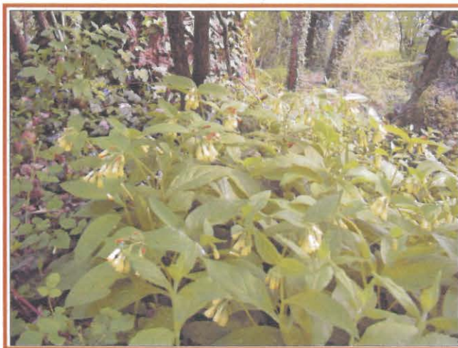
Le fioriture del sottobosco della Riserva