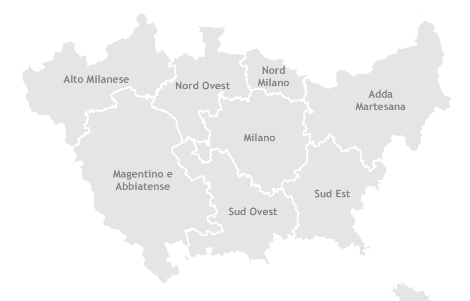
TAVOLA 9 1:70.000