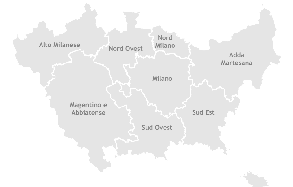
TAVOLA 1 1:70.000