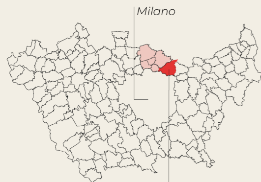
Sesto San Giovanni