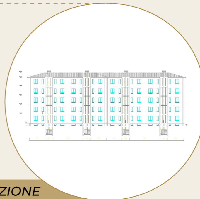
PROSPETTO E SEZIONE