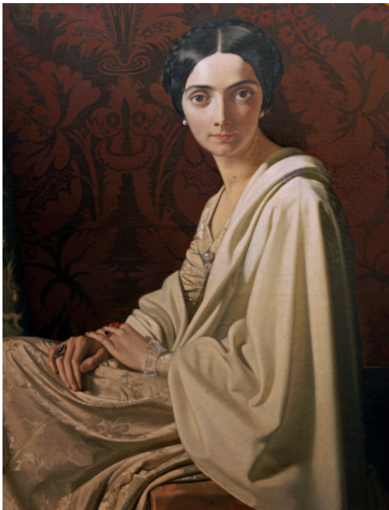
28 Henri Lehmann (Kiel 1814 - Parigi 1882)