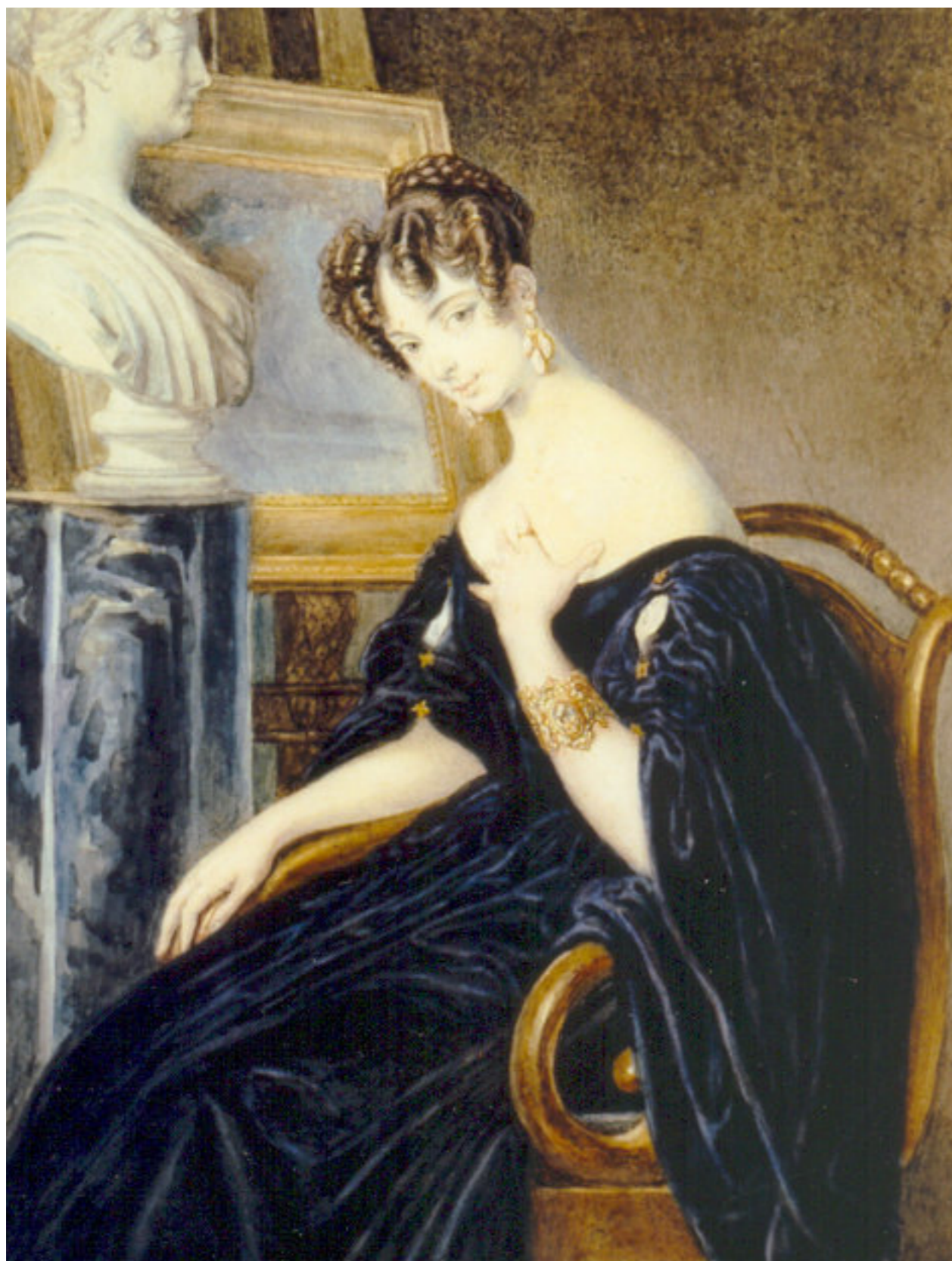
26 Francesco Hayez (attr.) (Venezia 1791 - Milano 1882)

“RITRATTO DI CRISTINA TRIVULZIO DI BELGIOJOSO” 1830-31