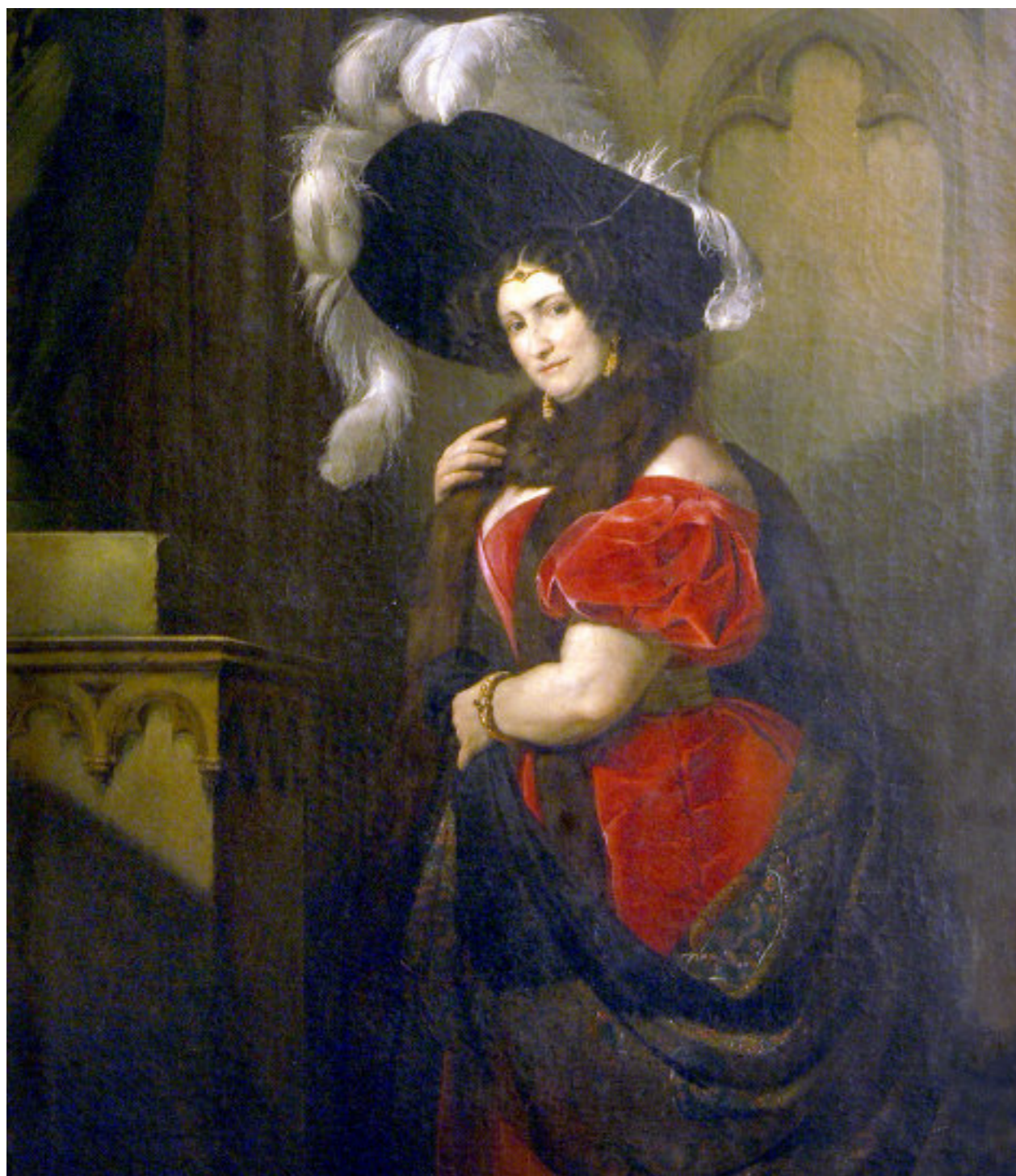
1 Giuseppe Molteni (Affori 1800 - Milano 1867)