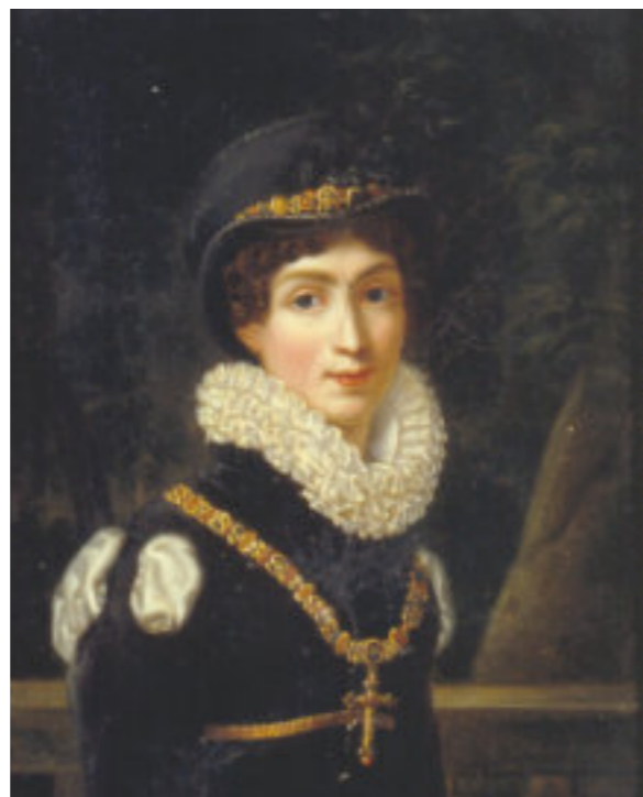
12-13 Joseph Stieler (attr.) (Mainz, 1781 - Monaco di Baviera, 1858)

“RITRATTO DI EUGENIO DI BEAUHARNAIS” “RITRATTO DI AUGUSTA AMALIA DI BAVIERA” 1815 circa