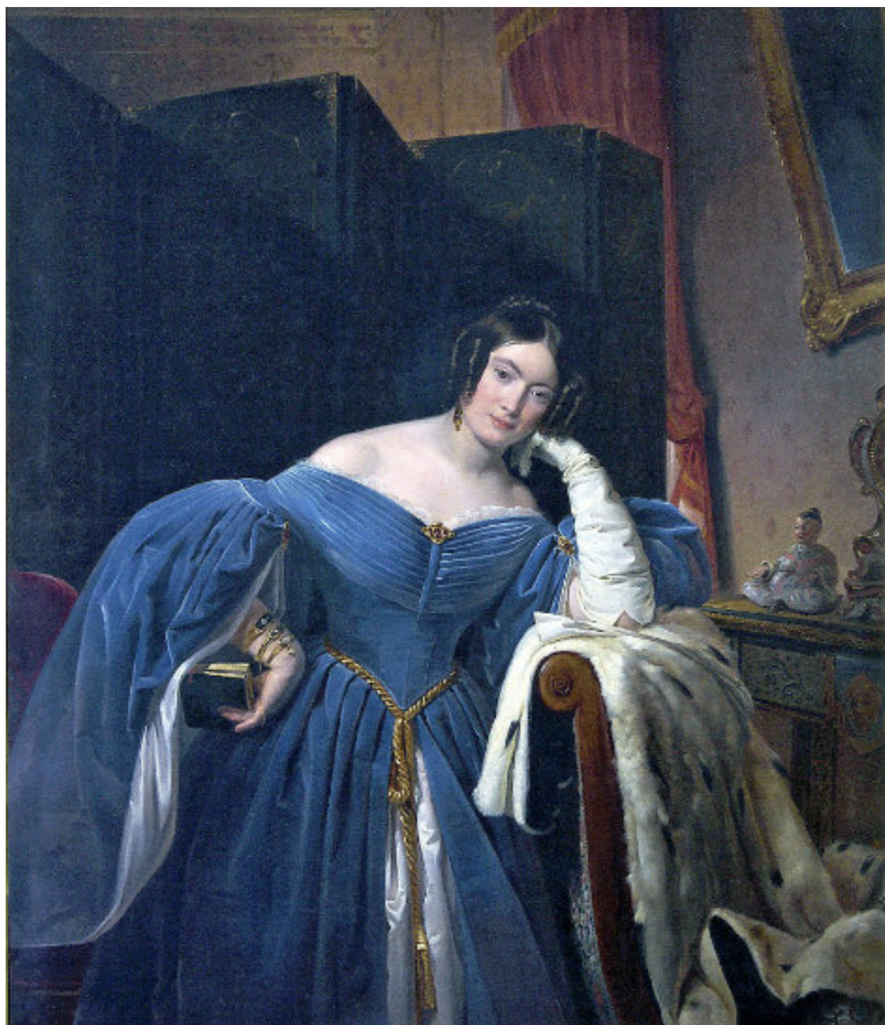
4 Giuseppe Molteni (Affori 1800 - Milano 1867)

“RITRATTO DI VIRGINIA VISCONTI D'ARAGONA DAL POZZO D'ANNONE”