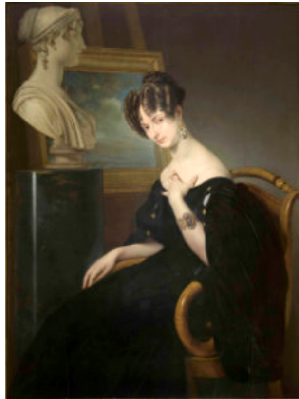
Francesco Hayez (Venezia 1791 - Milano 1882) "Ritratto di Cristina Trivulzio di Belgiojoso" 1830-31 (riproduzione) Olio su tela, 136 x 101 cm Collezione privata

attribuibile al suo esecutore Francesco Hayez. La protagonista è raffigurata con un bellissimo abito che le ricade sulle spalle, mettendo in evidenza il lungo collo sinuoso, l'incarnato pallido e le mani affusolate. Accanto a lei è collocato un busto in marmo, raffigurante la madre Vittoria Gherardini in silenzioso dialogo con la figlia esule, oggi conservato in una collezione privata e qui esposto al pubblico per la prima volta.