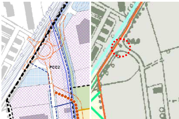
Rotatoria S.P. 39/via Addetta posta esternamente al Parco

Il progetto definitivo/esecutivo delle rotatorie è oggetto di una Conferenza di Servizi, indetta, con nota Prot. gen. n. 0158028 del 17/10/2022, dal Settore strade e mobilità sostenibili della Città metropolitana di Milano, nell’ambito della quale il Parco Agricolo Sud Milano ha espresso il proprio parere di competenza, al quale si rimanda, con deliberazione del Consiglio Direttivo Rep. n. 30 del 29/11/2022, ritenendo la previsione della rotatoria ammissibile e richiedendo di prevedere opportune misure di inserimento ambientale dell’opera.