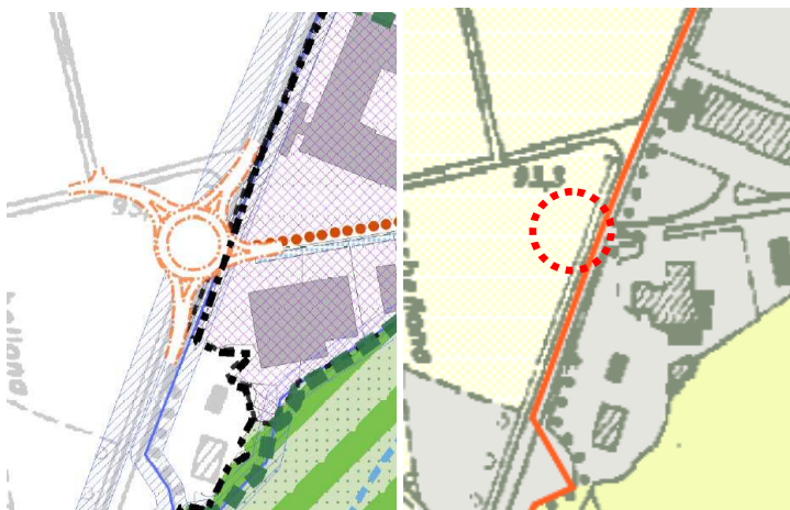
Rotatoria S.P. 39/via Rossini – via Buozi (Tribiano e Mediglia)

- M11) Modifica del tracciato del ponte di scavalco sul canale Addetta per ovviare a problemi di pendenze emersi in fase di progettazione. La modifica del progetto del ponte comporta, altresì, la traslazione verso sud della rotatoria esistente posta lungo la Strada comunale 705.